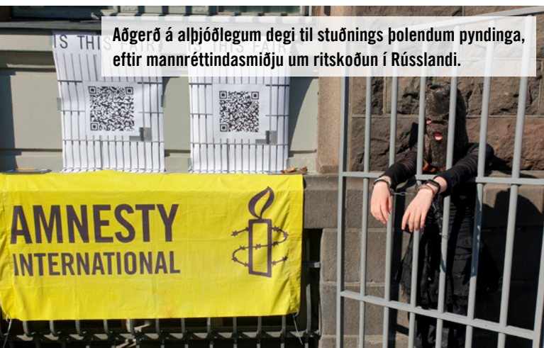
Aðgerð á alþjóðlegum degi til stuðnings þolendum pyndinga, eftir mannréttindasmiðju um ritskoðun í Rússlandi.