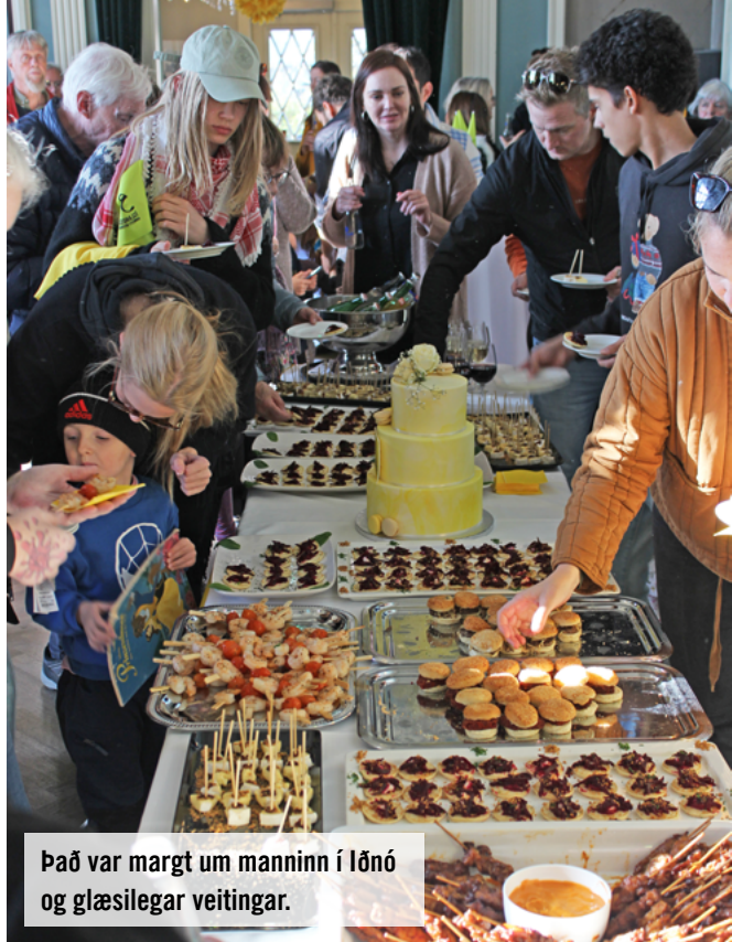
Það var margt um manninn í lónó og glæsilegar veitingar.