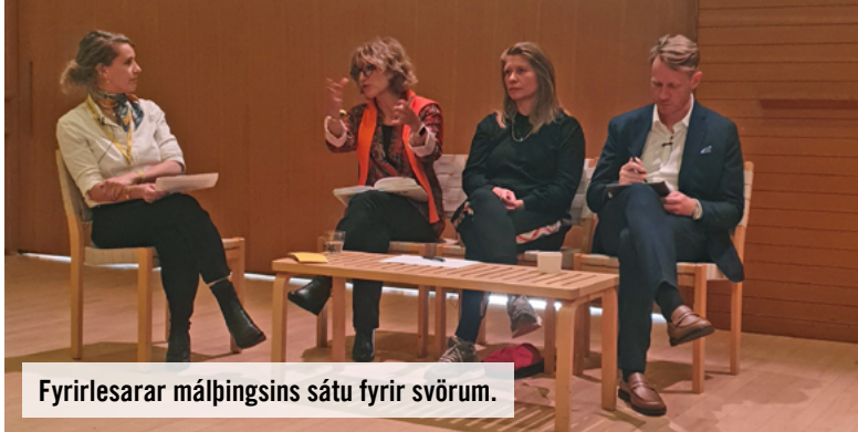
Fyrirlesarar málfingsins sátu fyrir svörum.