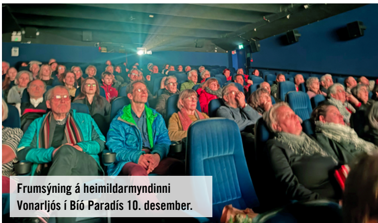
Frumnýning á heimildarmyndinni Vonarljós í Bíó Paradís 10. desember.

Frumnýningin var vel sótt og ánægjulegt hve mörg kunnugleg andlit mátti sjá. Myndin var svo sýnd í Ríkissjónvarpinu síðar um kvöldið. Einnig bauðst að horfa á hana í Sarpinum hjá RÚV fram til vorsins 2025.