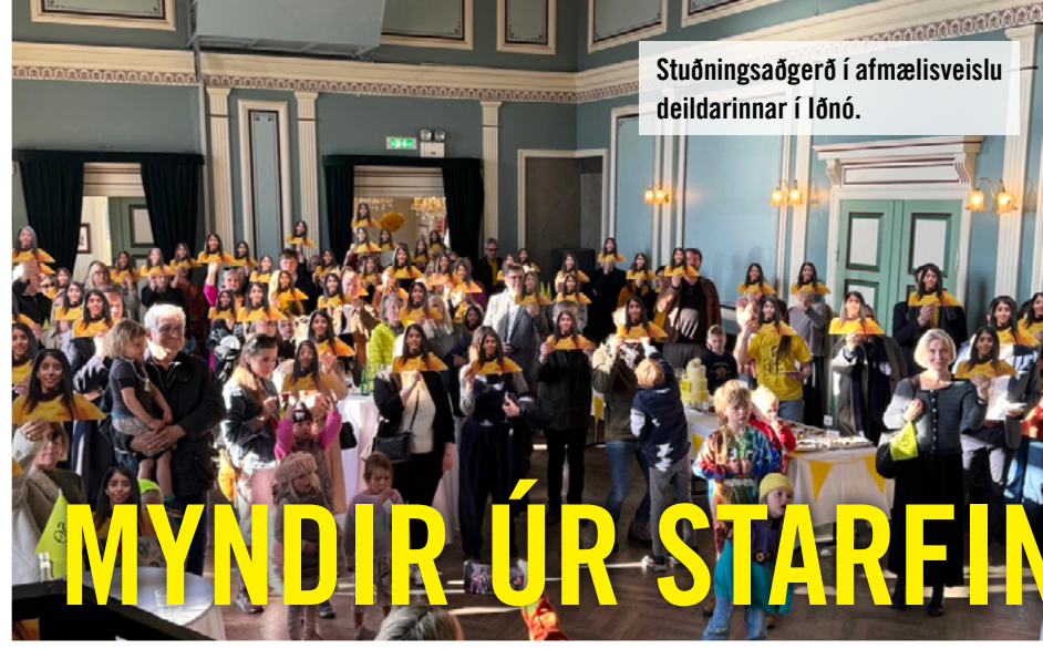
Stuðningsaðgerð í afmælisveislu deildarinnar í Iðnó.