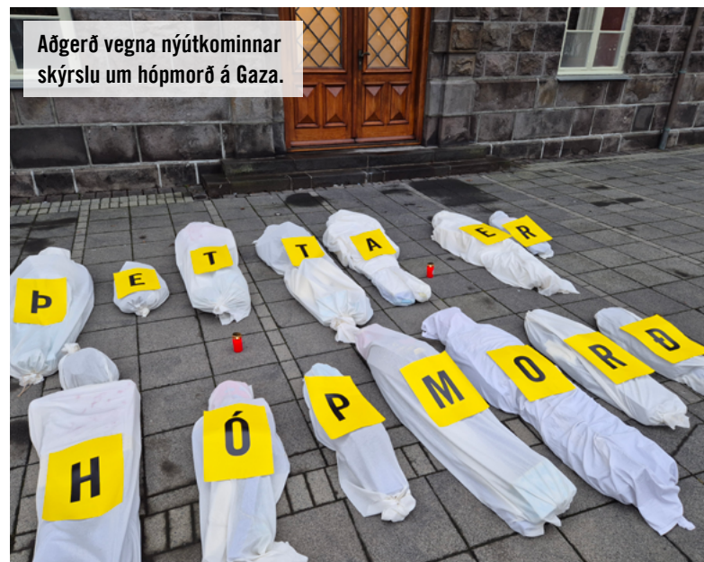
Aðgerð vegna nýtkominnar skýrslu um hóp morð á Gaza.