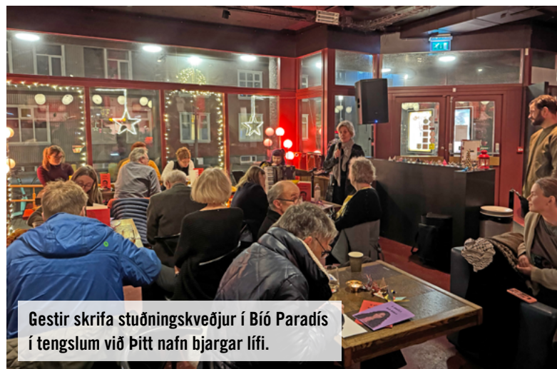
Gestir skrifa stuðningskveðjur í Bíó Paradís í tengslum við Þitt nafn bjargar lífi.

brekkuskóli og Hvolsskóli sem fengu til sín fræðslu. Alls söfnuðust 1.670 undirskriftir í þessum fjórum skólum á aðgerðakort og bréf.