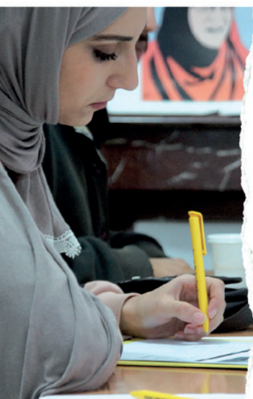
Pitt nafn bjargar lífi: Bréfaskrif í Alsír.