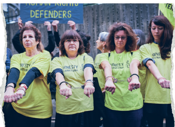
Aðgerðasinnar Amnesty International mótmæla fyrir utan tyrkneska sendiráðið í París í júlí 2017.

Með starfi okkar verndum við fólk og valdeflum það til að berjast fyrir ýmsum málefnum, þar á meðal afnámi dauðarefsingar, fyrir kyn- og frjósemisréttindum og gegn mismunun og réttindum flóttafólks og farandfólks. Við berjumst fyrir því að aðilar sem beita pyndingum verði dregnir fyrir dóm. Við beitum okkur fyrir því að fá lögum sem stuðla að kúgun breytt og við berjumst fyrir frelsi fólks sem hefur verið fangelsað fyrir það eitt að tjá skoðun sína. Við tökum málstað allra sem búa við skert frelsi eða mannvirðingu óháð uppruna.