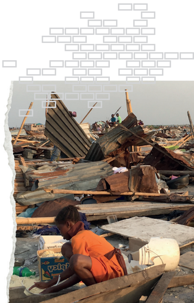
Aðstæður eftir þvingaða brotflutninga í Otodo Gbame.