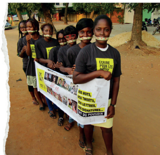
Aðgerðasinnar í Tógó.

Mannréttindi eru ekki munaður sem fólk fær aðeins að njóta þegar aðstæður leyfa.